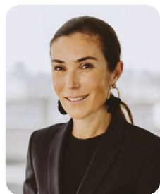
#SNCF Gares & Connexions

Directrice Générale SNCF Gares & Connexions