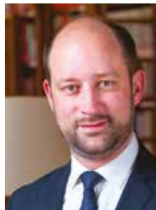
Loïc Hervé Président délégué de l'Association des petites villes de France Sénateur de la Haute-Savoie (74) Vice-président du Sénat